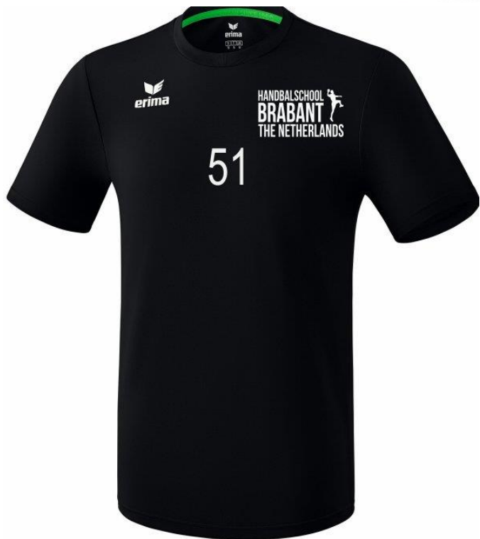
Keepershirt (kort of lang)