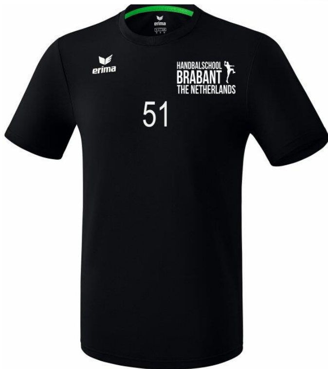
Keepershirt (kort of lang)