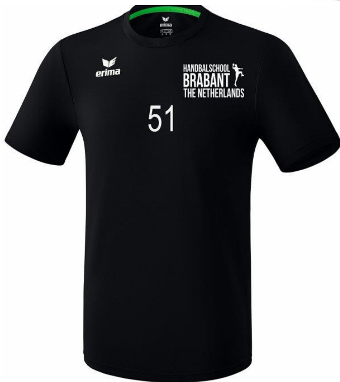
Keepershirt (kort of lang)